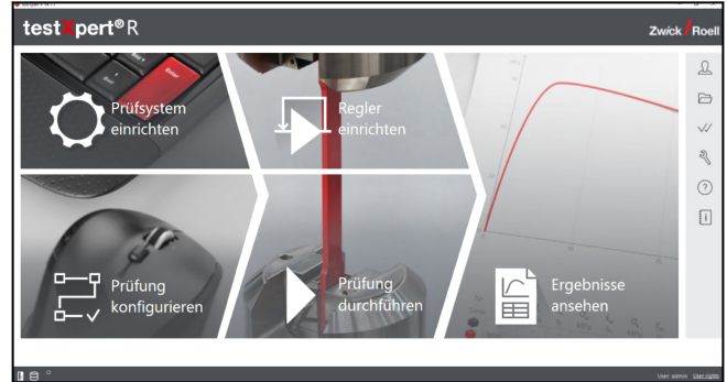
Startbildschirm testXpert R - Workfloworientierter Aufbau

In der Regel ist die Anzahl von Zyklen bis Probenbruch gefragt. Die Prüfergebnisse können als PDF-Protokoll oder im CSV-Format zur weiteren Verwendung in Excel exportiert werden. Während des Versuches können die Messdaten in frei einstellbaren Online-Grafiken live verfolgt werden.